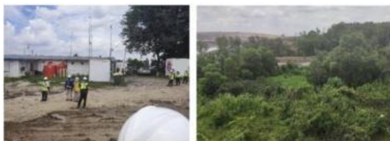
Gambar 3. Area Transfer Tower CV-T405 & CV-T406