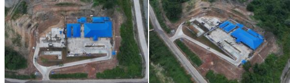
Gambar 8. Dokumentasi Area CHF