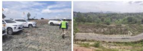
Gambar 4. Area CV-T404 & CV-T505 Underpass