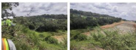
Gambar 5. Area Transfer Tower CV-T404 & CV-T505