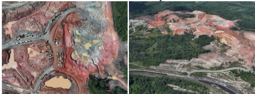
Gambar 6.2 Dokumentasi Area Rail Loop