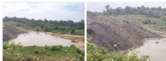
Gambar 2. Area Transfer Tower CV-T406