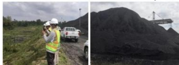
Gambar 6. Area Stockpile CHF