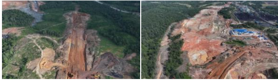
Gambar 7. Dokumentasi Area CHF

menuju TLS. Gambar 7 dan 8 memperlihatkan area coal handling facility (CHF) sebagai pusat proses penerimaan dan penyaluran batu bara dari stockpile . Sementara itu, Gambar 3.2 menunjukkan model 3D area conveyor CV-T501 yang digunakan sebagai acuan pemasangan sistem mekanikal di lapangan.