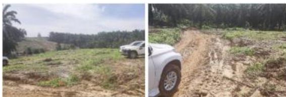
Gambar 1. Area CV-T406 & CV-T507