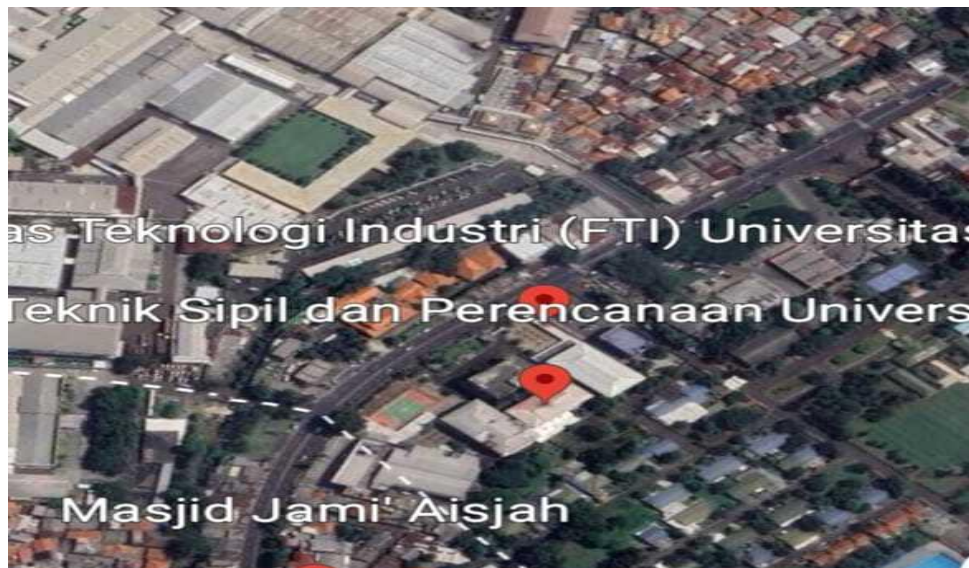
Gambar 1. Masjid Ummatun Jannah Kampus Cimanggis Universitas Jayabaya

Setiap tahun terdapat kecenderungan peningkatan jumlah jamaah di Masjid Ummatun Jannah yang terletak di dalam lingkungan Kampus Cimanggis Universitas Jayabaya, KM 28,8, Jakarta Timur. Peningkatan ini mendorong takmir masjid untuk terus berupaya melengkapi sarana dan prasarana penunjang kegiatan keagamaan di kampus. Salah satu langkah strategis yang direncanakan adalah rekonstruksi dan pengembangan area masjid, yang mencakup pembangunan tempat wudhu, serta gedung atau ruangan berbasis keagamaan.