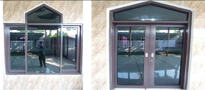
Gambar 5. Hasil Pemasangan Pintu dan Jendela Kaca Aluminium

Gambar 6 memperlihatkan tampilan akhir atap yang telah dilengkapi dengan penutup berupa genteng beton berwarna cokelat tua. Penutup atap menggunakan genteng beton berwarna cokelat tua yang kokoh dan tahan lama. Bentuk limasan bertingkat tetap dipertahankan untuk menjaga kenyamanan termal di dalam masjid, sekaligus menyelaraskan tampilan dengan bangunan sekitarnya. Hasil akhir ini menunjukkan keberhasilan dalam mewujudkan masjid yang aman, fungsional, dan representatif.