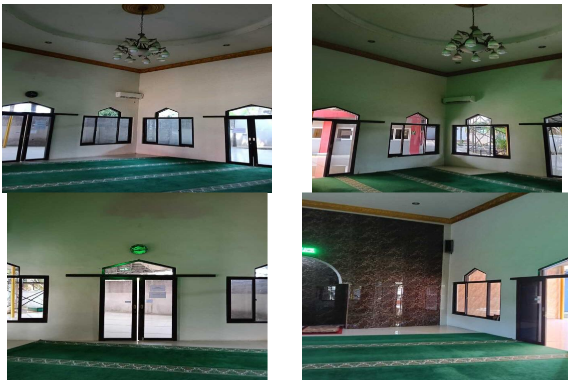
Gambar 9. Kondisi Interior Ruang Utama Masjid Ummatun Jannah Setelah Renovasi

Gambar ini menampilkan kondisi interior ruang utama Masjid Ummatun Jannah pasca renovasi, yang menunjukkan peningkatan signifikan dari sisi kenyamanan dan estetika. Ruang utama salat kini dilengkapi karpet hijau bermotif islami dan pencahayaan alami dari jendela-jendela besar berbentuk lancip. Lampu gantung di plafon menambah estetika ruangan, sementara dinding mihrab dilapisi keramik marmer gelap yang mempertegas arah kiblat. Secara keseluruhan, renovasi ini berhasil menciptakan ruang ibadah yang nyaman, representatif, dan sesuai dengan kebutuhan civitas akademika kampus.