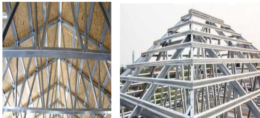
Gambar 4. Struktur Atap Masjid Hasil Renovasi

Luaran dari kegiatan ini berupa dokumentasi visual dalam bentuk foto-foto hasil renovasi Masjid Ummatun Jannah, yang menunjukkan perubahan kondisi fisik sebelum dan sesudah pelaksanaan kegiatan. Dokumentasi ini mencakup area utama masjid, fasilitas tempat wudhu, serta ruang penunjang lainnya yang telah selesai direnovasi. Hasil ini menjadi bukti nyata keberhasilan kegiatan pengabdian dalam mewujudkan masjid yang lebih layak, bersih, dan nyaman. Foto-foto tersebut diharapkan dapat digunakan oleh pihak takmir masjid dan institusi kampus sebagai bahan evaluasi, laporan pertanggungjawaban, serta referensi untuk pengembangan fasilitas serupa di masa mendatang.