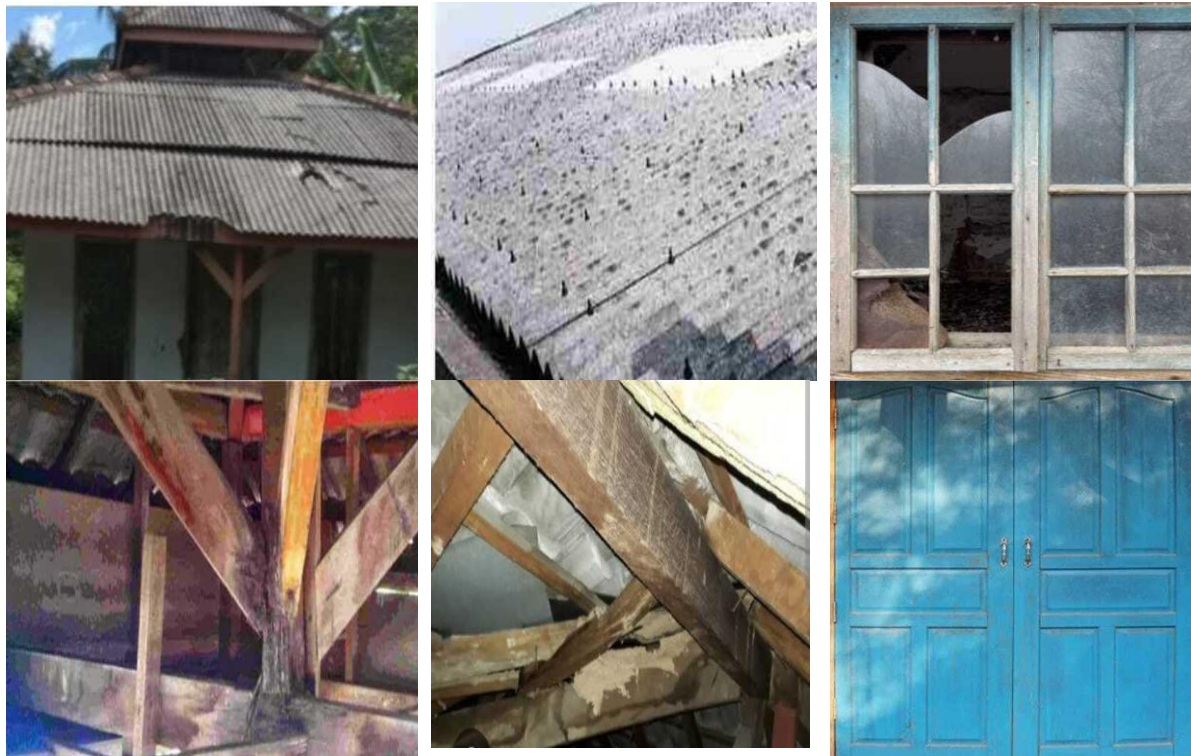
Gambar 3. Kondisi Bangunan Masjid Ummatun Jannah Sebelum Renovasi

Proses renovasi ini tidak hanya bertujuan untuk mendukung pengembangan fasilitas Masjid Ummatun Jannah, tetapi juga merupakan penerapan keahlian di bidang teknik sipil dalam merespons kebutuhan fasilitas ibadah di lingkungan kampus. Penyusunan gambar teknis dan perhitungan Rencana Anggaran Biaya (RAB) dilakukan langsung oleh tim dosen pelaksana sebagai bentuk kontribusi akademik terhadap pengembangan sarana keagamaan yang representatif dan fungsional di kawasan Kampus Cimanggis Universitas Jayabaya.