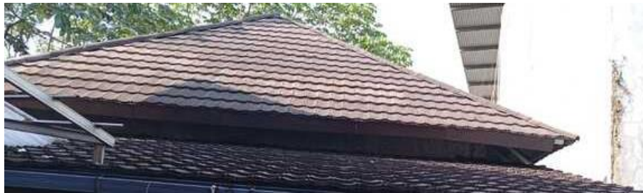
Gambar 6. Tampilan Atap Masjid Ummatun Jannah Setelah Renovasi

Gambar 6 memperlihatkan tampilan akhir atap yang telah dilengkapi dengan penutup berupa genteng beton berwarna cokelat tua. Penutup atap menggunakan genteng beton berwarna cokelat tua yang kokoh dan tahan lama. Bentuk limasan bertingkat tetap dipertahankan untuk menjaga kenyamanan termal di dalam masjid, sekaligus menyelaraskan tampilan dengan bangunan sekitarnya. Hasil akhir ini menunjukkan keberhasilan dalam mewujudkan masjid yang aman, fungsional, dan representatif.