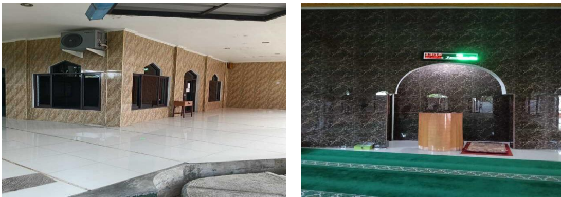
Gambar 8. Tampilan Serambi dan Interior Masjid Ummatun Jannah Pasca Renovasi

modern namun tetap fungsional. Perubahan ini mendukung kenyamanan jamaah dan memperkuat identitas masjid sebagai pusat ibadah di kampus.