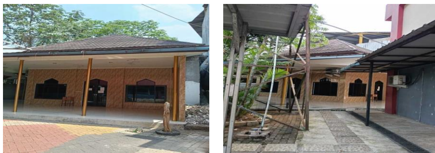
Gambar 7. Tampilan Akhir Masjid Ummatun Jannah Dari Sisi Luar Setelah Proses Renovasi

Fasad masjid diperbarui dengan keramik bermotif batu alam yang memberi kesan elegan dan rapi. Pintu dan jendela baru berbahan aluminium dilengkapi tiang penyangga berwarna emas yang memperkuat kesan modern. Area teras diperluas dengan lantai keramik putih yang bersih, serta penataan ulang selasar kampus menciptakan hubungan visual dan fungsional yang lebih harmonis antara masjid dan lingkungan sekitarnya. Tampilan akhir Masjid Ummatun Jannah dari sisi luar setelah proses renovasi selesai dilaksanakan ditunjukkan pada gambar 7.